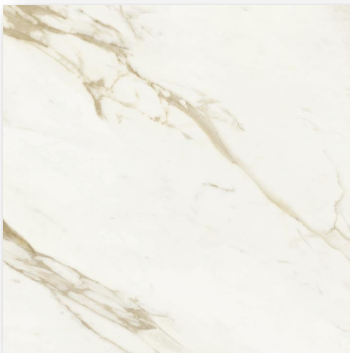
Керамический гранит Adaggio Gold Pulido 60x60см