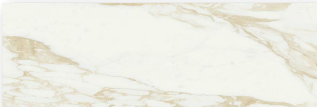
Керамическая плитка Adaggio Flash Gold 40x120см